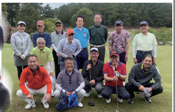
春の合同ゴルフコンペ