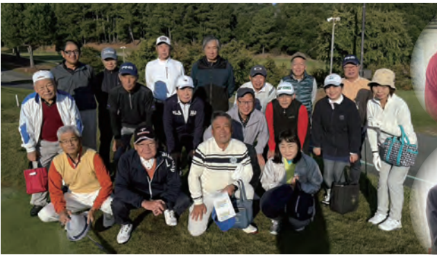
秋の合同ゴルフコンペ